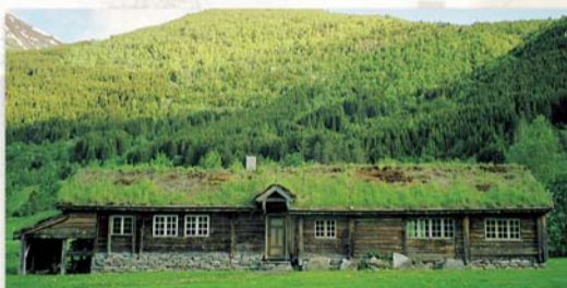
Løsetstova kjem som namnet seier frå garden Løset i Røysetdalen. Dette er ei typisk sunnmørsstove, som vart bygd på 1790-talet.