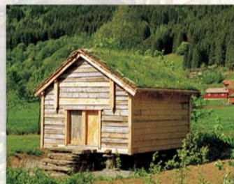
Stabburet kjem frå garden Busengdal og er bygd ca. 1750

Desse to bygningane er eigd av Fortidsminneforeninga.